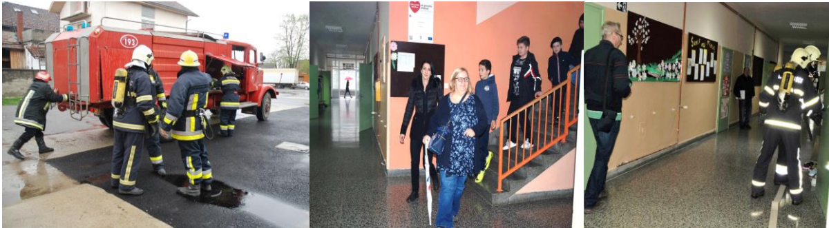
VJEŽBA EVAKUACIJE „ POŽAR 2019.“