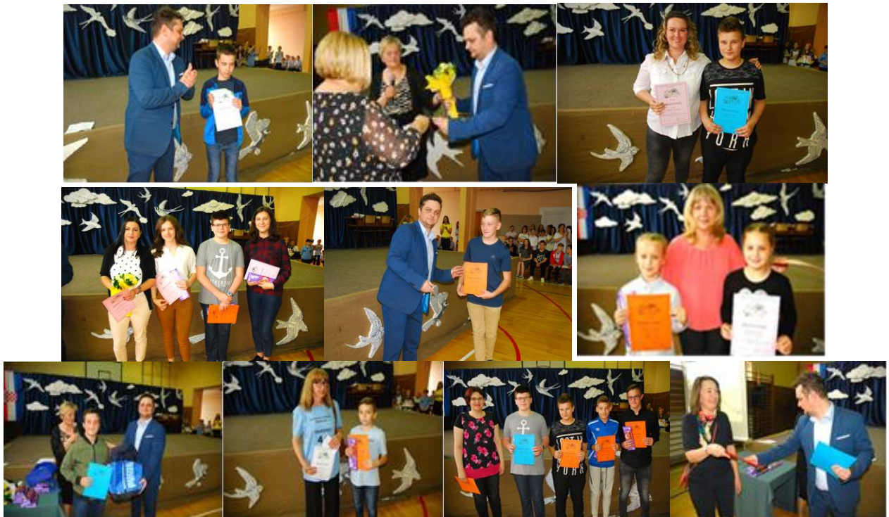
PRIZNANJA - DAN ŠKOLE – POSTIGNUĆA- NATJECANJA